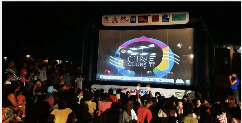
Figura 3: Proyección pública del documental “Somos nosotros para nosotros” en el barrio Terra Firme.

A partir de entonces, los jóvenes empezaron a dar a conocer el documental en el barrio donde viven, en lugares considerados peligrosos por los medios de comunicación. La intención era ocupar estos espacios con actividades culturales. Además de proyectar la película, el grupo empezó a organizar veladas culturales, coordinadas por seis miembros, que incluían recitales de poesía, presentaciones de danza, exposiciones de dibujo y fotografía, y talleres para los niños del barrio, con un impacto directo en 50 jóvenes (en promedio), e indirecto en muchos vecinos del barrio. Así, las calles de Terra Firme pasaron a ser ocupadas por el arte, la cultura y el ocio, dejando de ser un mero espacio de desplazamiento para convertirse en un fuerte punto de socialización entre los residentes, mediado por la producción de estos jóvenes, protagonistas de sus narrativas (Gouvêa & Miranda, 2021). Para Albán Achinte (2007), el acto de crear asume la función de reafirmar la existencia de aquellos que han sido privados de sus identidades, resistiendo la supresión. De esta forma, el acto creativo permite engendrar actos liberadores en cuanto a pensar, ser, conocer, comprender y vivir, generando espacios de reexistencia y construyendo conexiones entre personas, causas, luchas, territorios e identidades.