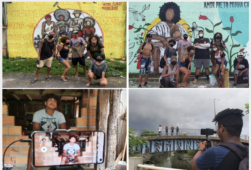
Figura 4: Algunas de las iniciativas culturales llevadas a cabo por el grupo (2020/2021).

comprometiendo la continuidad de la investigación académica. De este modo, la profesora, los jóvenes del Cine Club TF y yo buscábamos formas de mantenernos conectados incluso a distancia. Así fue como decidimos redactar propuestas de proyectos culturales para buscar patrocinio. Los fondos recaudados fueron destinados a diversas iniciativas, como nuevos documentales, grafitis en puntos estratégicos del barrio, presentaciones artísticas en línea y talleres a distancia. Por lo tanto, las expresiones artísticas de los jóvenes no se vieron interrumpidas por el aislamiento social obligatorio (G1 PA, 2021).