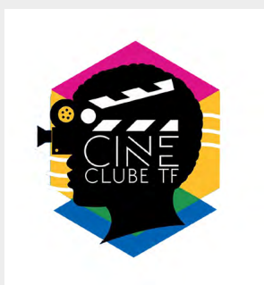
Figura 5: Imagen de marca del proyecto Cine Club TF.

Cuando pregunté a los coinvestigadores si esa composición gráfica los representaba, surgieron testimonios relacionados con el origen del proyecto. Es importante recordar que la memoria no es estática: al contrario, se construye y es controvertida, especialmente cuando se trata de un colectivo (Cardoso, 2013). La