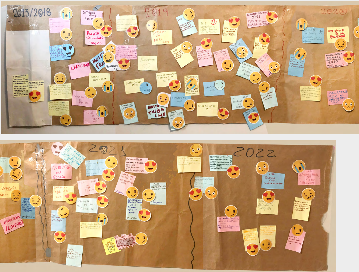
Figura 6: Linha de tempo articulada por o grupo.

En una tercera etapa, recogimos los temas generadores planteados por el grupo y realizamos un análisis crítico colectivo de las palabras seleccionadas. El objetivo fue reflexionar sobre las cuestiones estructurales detrás de los aparentes problemas, intentando generar síntesis sobre las “situaciones límite” (Freire, 2005) que surgen como obstáculos para el colectivo. Llamamos a este recurso Ciranda Pedagógica (Círculo Pedagógico), donde cada subgrupo analizó los desafíos y sugirió posibles formas de resolverlos. La actividad resultó en cuatro marcadores para el proyecto: comunicación, movilización, formación e infraestructura. A partir de ahí, desarrollamos hipótesis acerca de que dichos retos eran los más evidentes, y cómo estaban vinculados a procesos estructurales que era necesario superar. Entendiendo que esa superación debía seguir una estrategia a largo plazo, consideramos oportuno transformar las categorías desarrolladas en grupos de trabajo, para que estos pudiesen dedicarse en forma continua a definir estrategias para resolver los problemas asociados a esas categorías.