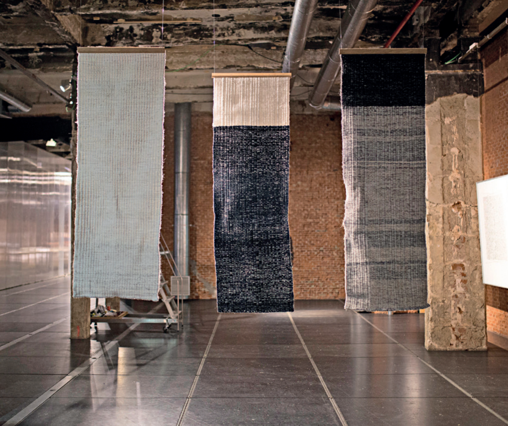
Y su campo bordado con flores _ And its countryside embroidered with flowers.