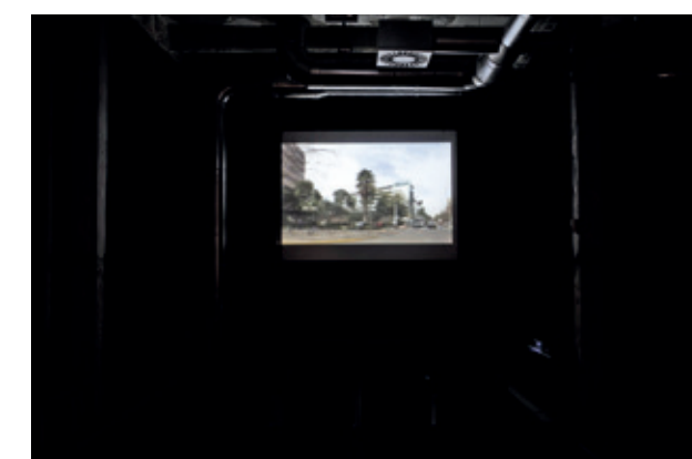
North Facing, Second Home, Pilling Up (2012) _ Verano (2016)

La hemos llamado TEST porque, como organización, sabíamos desde dónde partimos, pero, con certeza, ni nosotros ni ninguno de nuestros invitados sabía exactamente en qué y dónde terminaban estos márgenes. We've named it TEST because, as organization, we knew from where we were starting, but, certainly, not us nor any of our guests knew exactly in what or where did these margins end.