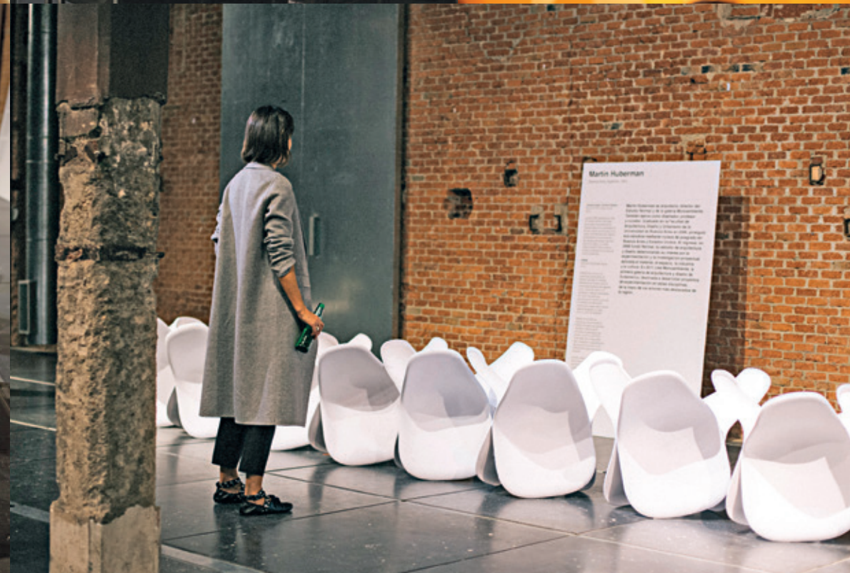
DSW (Dining Side Shell Wood)