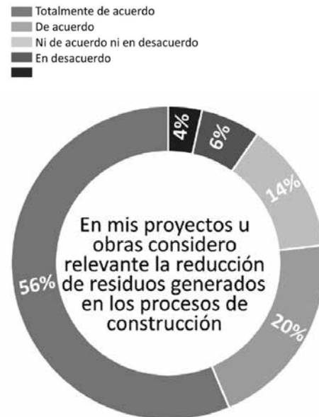
FIG. 04: En mis proyectos u obras considero relevante la reducción de residuos generados en los procesos de construcción. Autor: Roger Saintard.