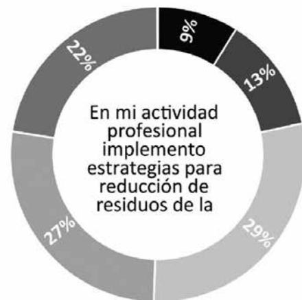
FIG. 05: En mi actividad profesional implemento estrategias para reducción de residuos de la construcción. Autor: Roger Saintard.