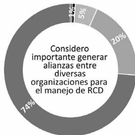
FIG. 06: Considero importante generar alianzas entre diversas organizaciones para el manejo de RCD. Autor: Roger Saintard.