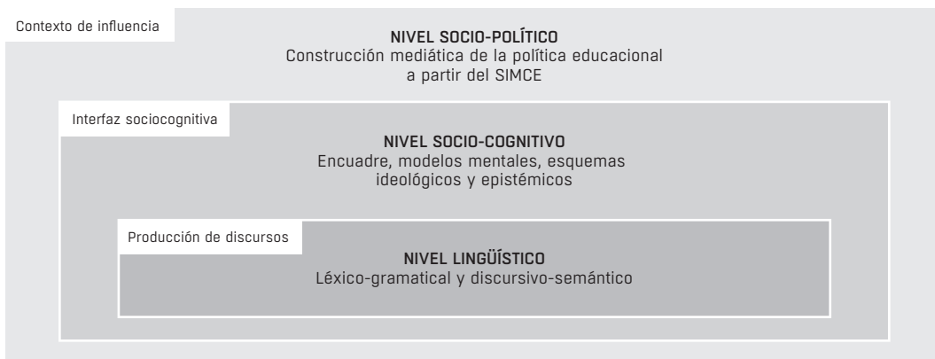
Figura 2. Propuesta de investigación sobre la representación mediática del SIMCE

Fuente: Elaboración propia con base en Titscher et al. (2000).