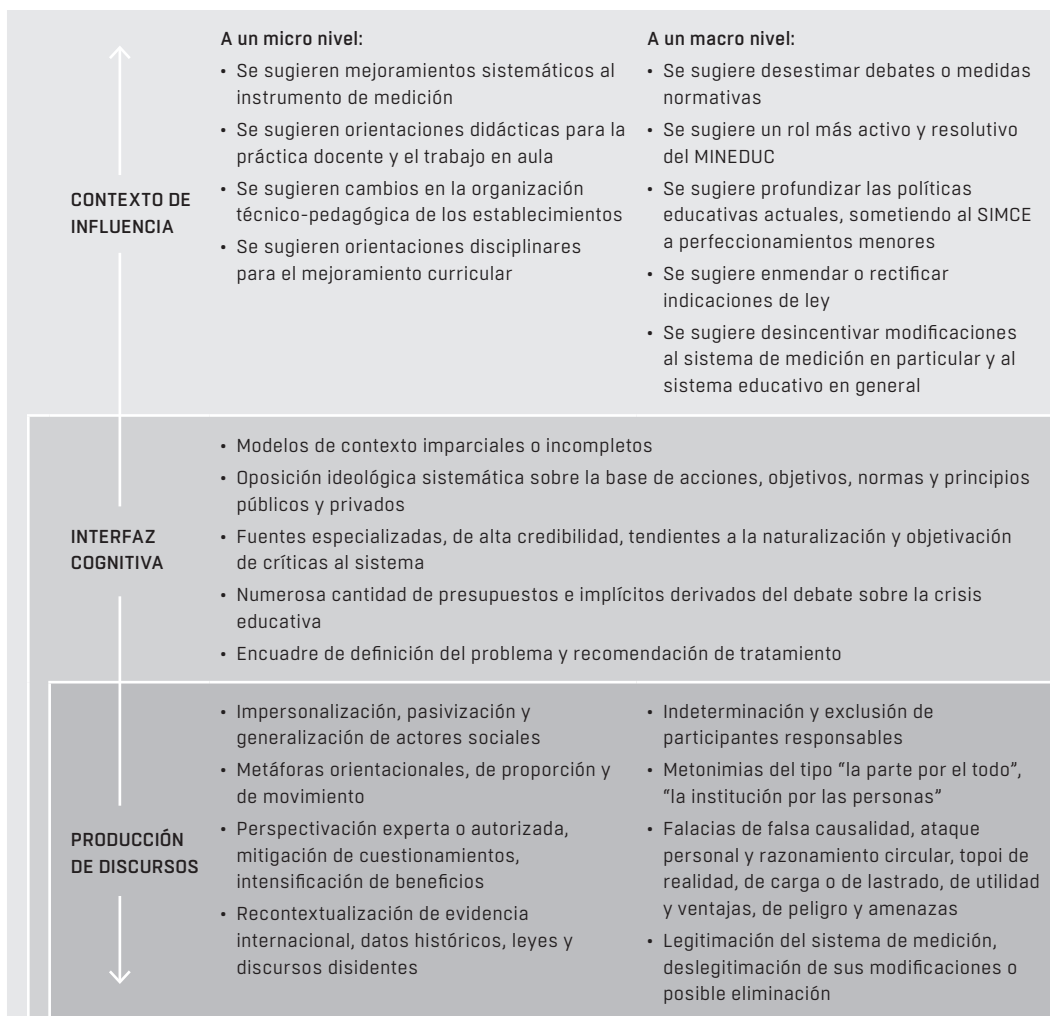
Figura 3. Síntesis de resultados por dimensión estudiada